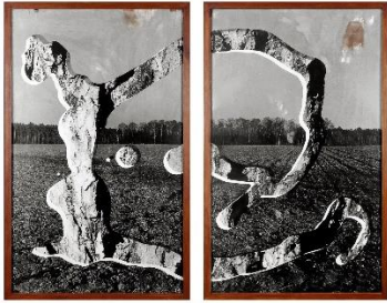
Caroline Dlugos, »Imaginäre Skulptur-L6«, 1991, Diptychon, Silbergelatinefotografie (Unikat), 220 x 284 cm, Unikat © Caroline Dlugos