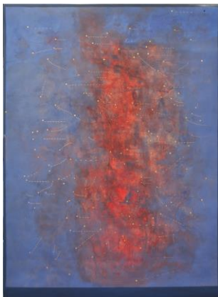
Rosário Rebello de Andrade, »Ohne Titel (Deutschland), Übungskarte (Doppelseitig)«, 2016, Pigment, und Blattgold auf alter Schulkarte, 93 x 127,5cm cm © Rosário Rebello de Andrade