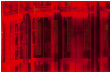
Margareta Hesse, » Fassaden Berlin III«, 2013, Fotografie, Schellack und Farblack auf 2 Polyesterplatten, 160 x 250 x 8 cm © Margareta Hesse